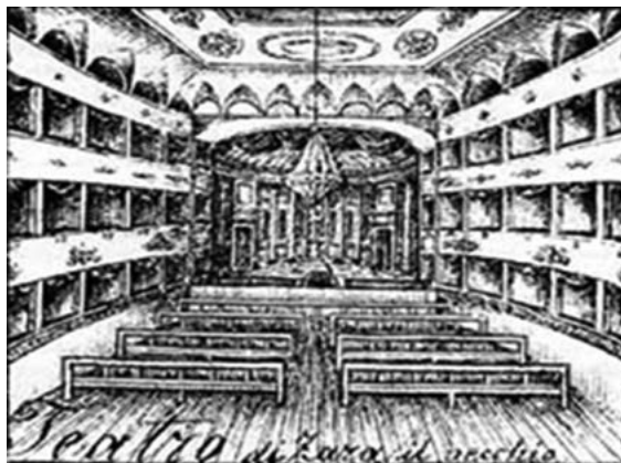
Figure 3. Sketch of the interior of the Nobile Teatro (Perković, 1989, 30)